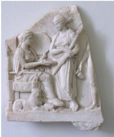
Cibeles, Ecate e Hermes